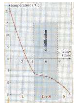
DOC. 8. Évolution de la température en fonction du temps lors de la solidification d'une eau salée.